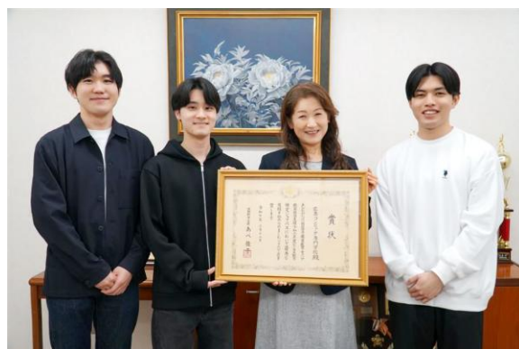
指導を担当する大成先生と学生のみなさん

B 検 NewsPlus では授業で使える演習問題も紹介しています。バックナンバーは公式サイトで公開中。